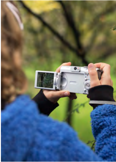
Ateliers images et théâtre cie_avec