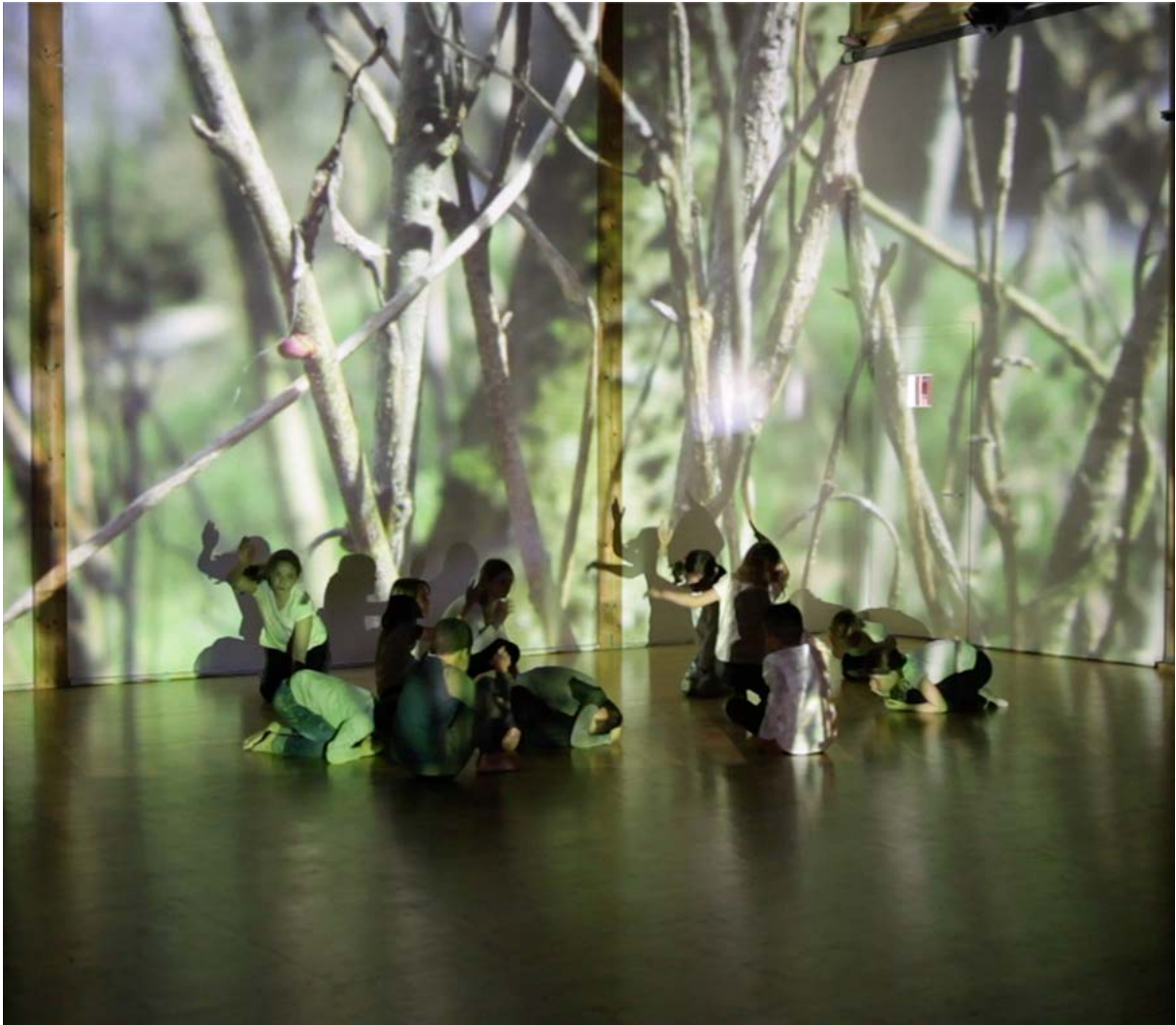
La vie des plantes - capture d'écran - printemps 2022