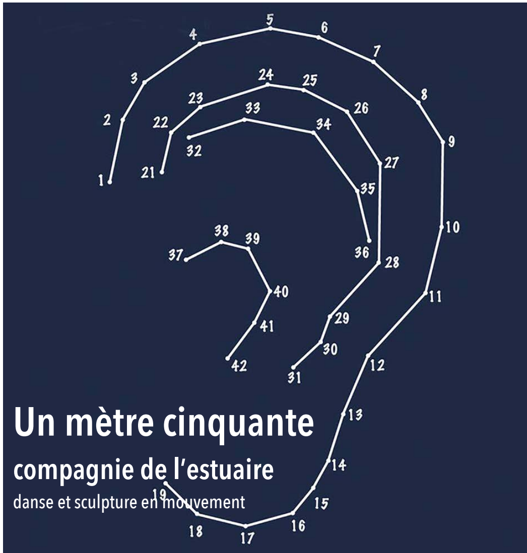
Un mètre cinquante - projet de création en milieu scolaire - février et mars 2022