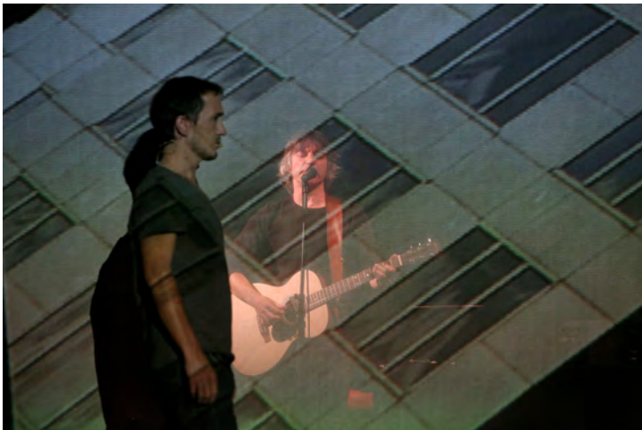
Highway | cie_avec | septembre 2013

Les arts de la scène – de même que les arts en général, que les sciences humaines et sociales ou les sciences de la nature – sont à la fois un écho à la réalité culturelle, sociale et économique de notre époque, et à la fois des déclencheurs de changements de cette réalité.