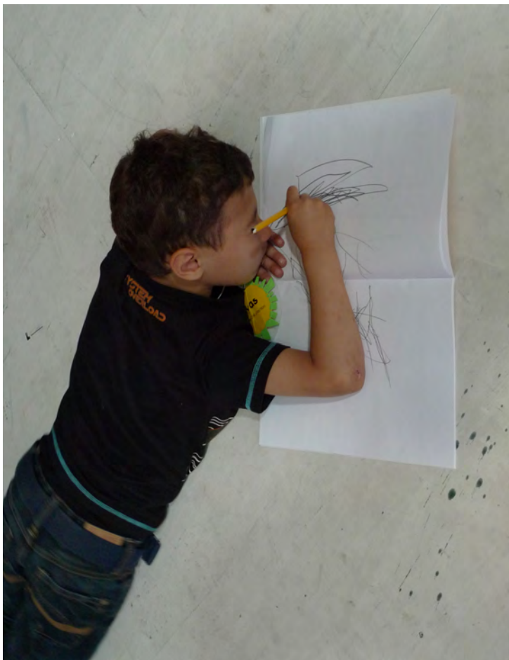
Les Gens des Villes, atelier danse et graphie | cie de l'estuaire mai 2011