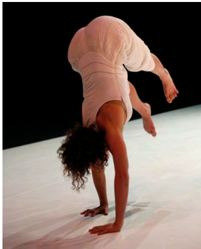
Forces | cie de l'estuaire mai 2014

Les fondamentaux. Le corps, l'espace, le rythme, la dynamique, les interrelations sont les fondamentaux de la danse. Les variations de leur combinaison donne une couleur, un style particulier à la danse.