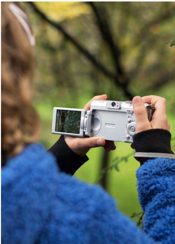
Ateliers images et théâtre | cie_avec