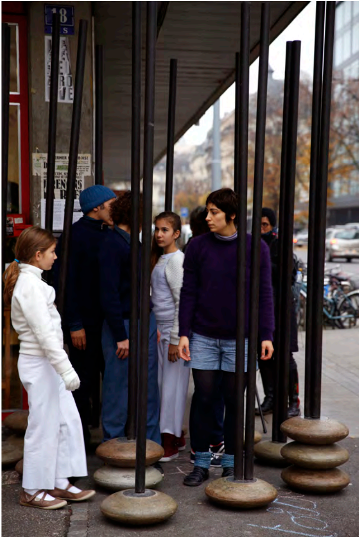
Cache-cache | création in situ, cie de l'estuaire novembre 2014