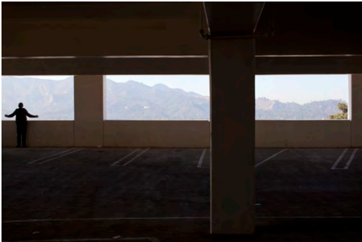
Angels | cie_avec | 2014

L'image apparaît sur les voûtes des grottes préhistoriques bien avant l'édification de monuments ou l'élaboration de l'écriture. L'image abolit le temps et l'espace. Elle est lecture instantanée et présence immédiate du monde. Pourtant sa richesse est ambiguë et son pouvoir d'aliénation extrême. L'image sert de vérité. La mythologie moderne consacre le règne de l'image