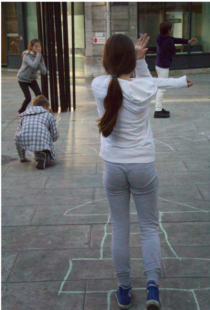
Cache-cache | création in situ, cie de l'estuaire novembre 2014