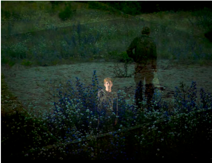
Marzahn | cie_avec | 2012