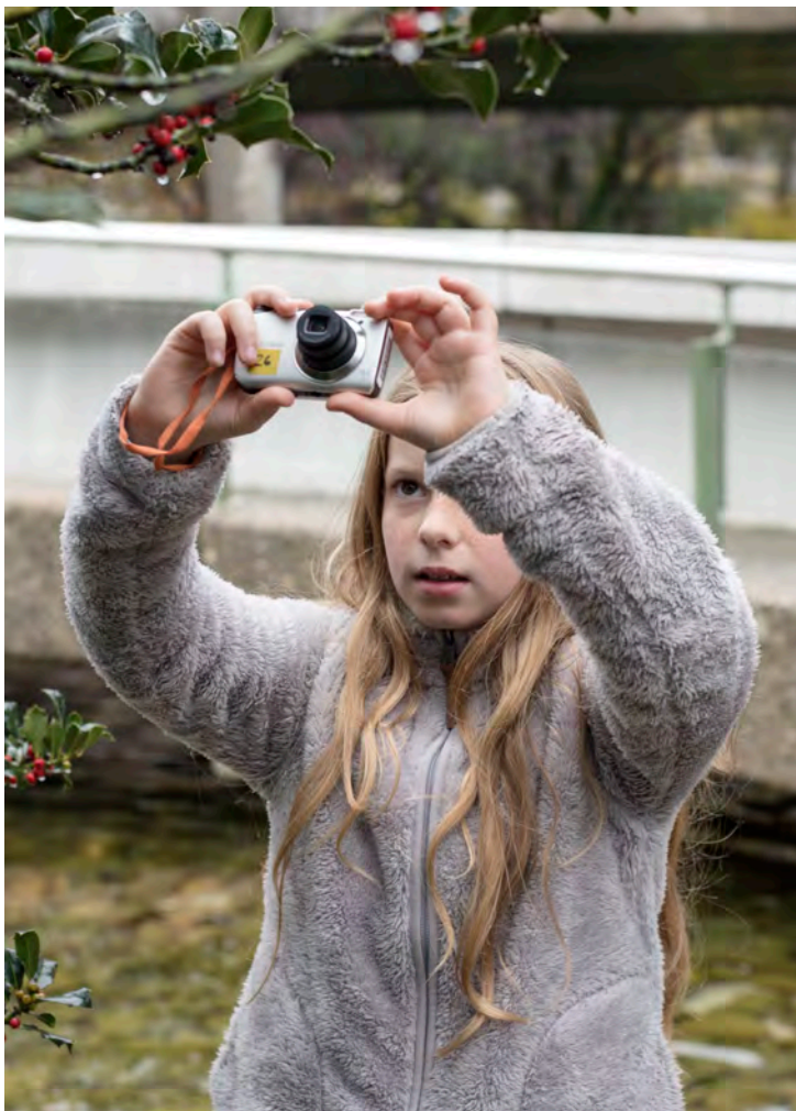
Ateliers images et théâtre | cie_avec